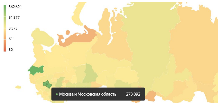
График визитов сайта за последний год.

Географически аудитория Информационного Агентства сосредоточилась в Санкт-Петербурге и Ленинградской области, а также в Москве и Московской области.